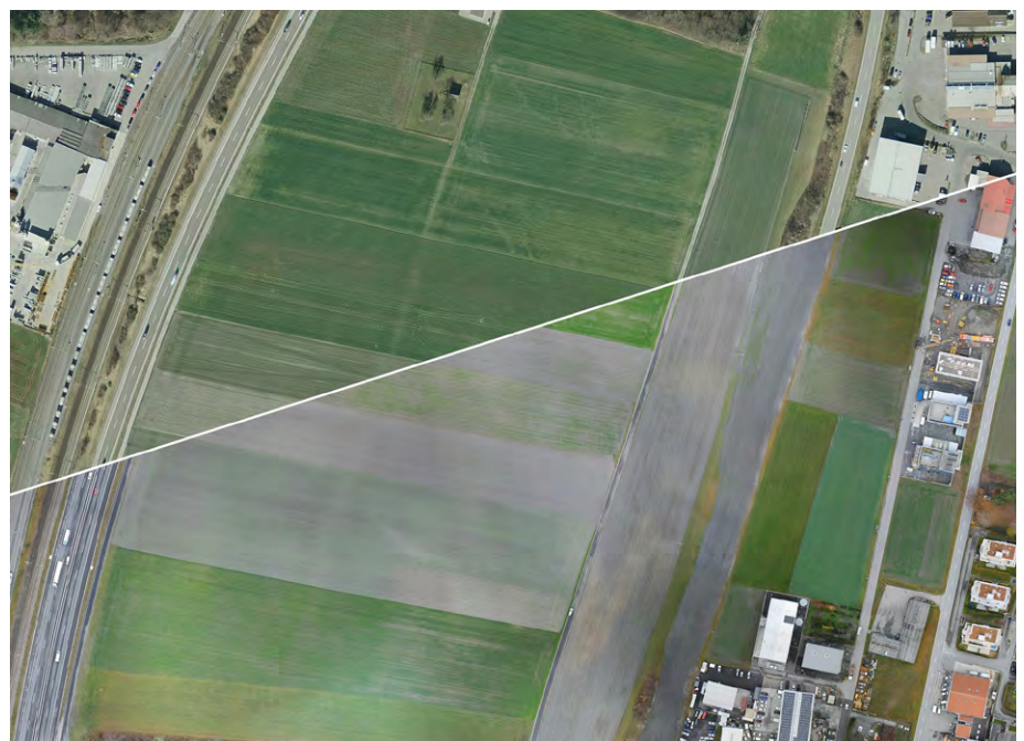
Abb. 2: Vergleich der Orthofotos von 2014 (oben) und Dezember 2018 (unten), Neubau Nordspur (links) und Rekultivierung alte Trasse (rechts).

Die Teilmelioration Trimmis beinhaltet zusätzlich zum Landumlegungsverfahren auch den Aus- und Neubau eines einheitlichen und den heutigen Anforderungen angepassten Güterstrassennetzes (Abb. 3). Im Rahmen der baulichen Umsetzung wurden landwirtschaftliche Güterstrassen und Bewirtschaftungswege mit einer