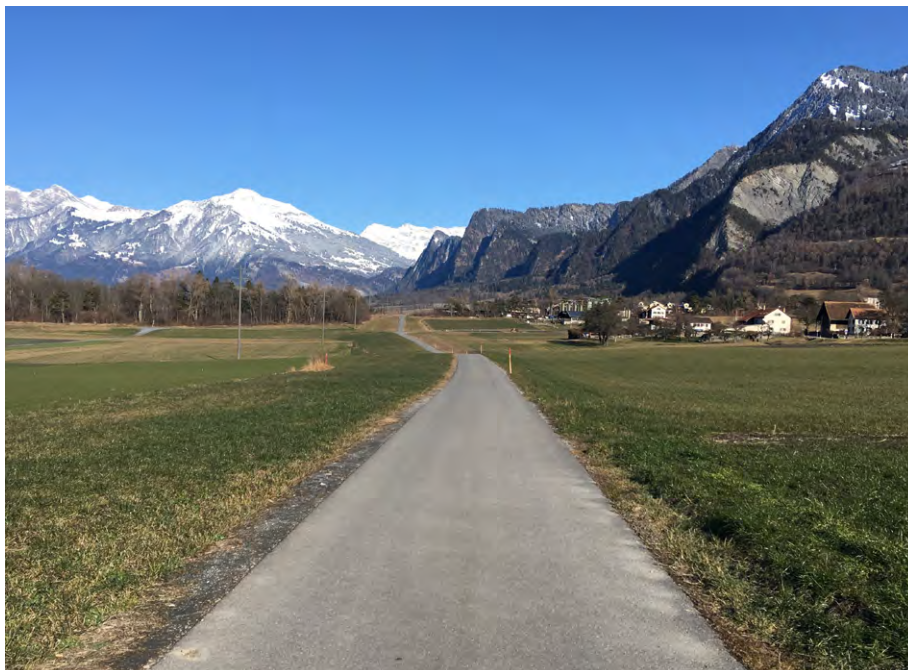
Abb. 4: Auf dem alten Trasse der Nordspur neu erstellte Güterstrasse, Blick in Richtung Norden.

Gesamtlänge von 6,2 km erstellt (Abb. 4). Nicht mehr benötigte Güterstrassen im Umfang von ca. 1,5 km wurden rekultiviert. Die Bauarbeiten am Güterstrassennetz konnten im November 2018 abgeschlossen werden.