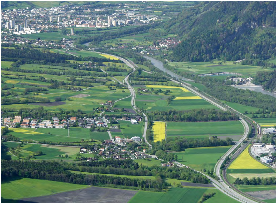
Abb. 1: Nationalstrasse A13 bei der Verzweigung Trimmis/Untervaz, Blick in Richtung Süden.

schen der Süd- und ehemaligen Nordspur der A13 von der Gemeindegrenze Chur/Trimmis bis zum Anschluss Zizers/Untervaz. Die landwirtschaftliche Nutzfläche im Bezugsgebiet wird von insgesamt 15 Betrieben bewirtschaftet. Haupterwerbszweig ist die Milchproduktion, daneben wird in grossem Umfang Ackerbau und Aufzucht betrieben.