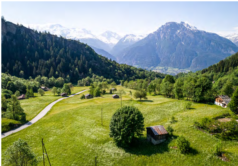
Abb. 2: Hangbewässerungslandschaft am Natischerberg.

anlagen (Beregnung) weitere Modernisierungen der Bewässerung. Die Umstellung der Bewässerung auf Beregnung betraf ab 1950 vor allem die Spezialkulturen, ab 1970 auch teilweise die Naturwiesen. Gleichzeitig wurde im Zuge des landwirtschaftlichen Strukturwandels und der damit in bestimmten Regionen einhergehenden Extensivierung oder Aufgabe der Nutzung die Bewässerung an einigen Orten aufgegeben (Gerber & Papilloud 2015). In diesem Zusammenhang begannen erste Wasserwasserleitungen zu zerfallen und damit auch die typische Bewässerungslandschaft zu verschwinden.