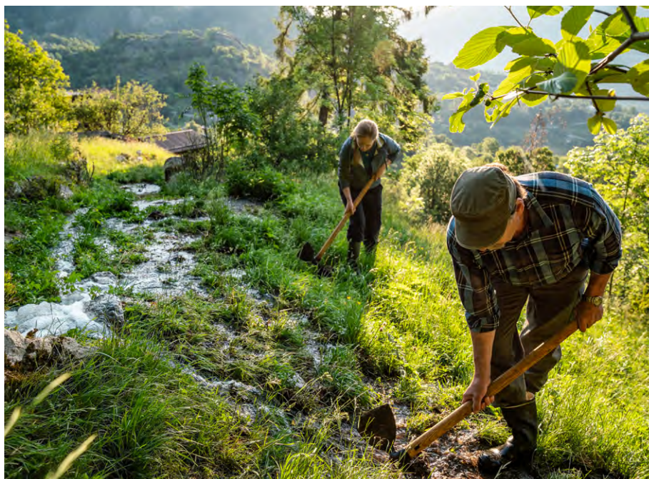
Abb. 4: Feinverteilung des Wassers auf den Wiesen.

In Ausserberg : Die Gemeinde Ausserberg, welche im Jahr 1914, nach grossen Zerstörungen an den Suonen im Baltschiederatal, die Verantwortung für den Erhalt der Bewässerungskanäle übernommen hat und heute immer noch trägt; der SAC Blümlisalp (Sektion Ausserberg), welcher sich nach Erstellung des Stollens für die Suone Niwärch im Jahr 1972 verpflichtet hat, den jährlichen Unterhalt (Gemeinwerk) für den historischen Lauf der Ni-