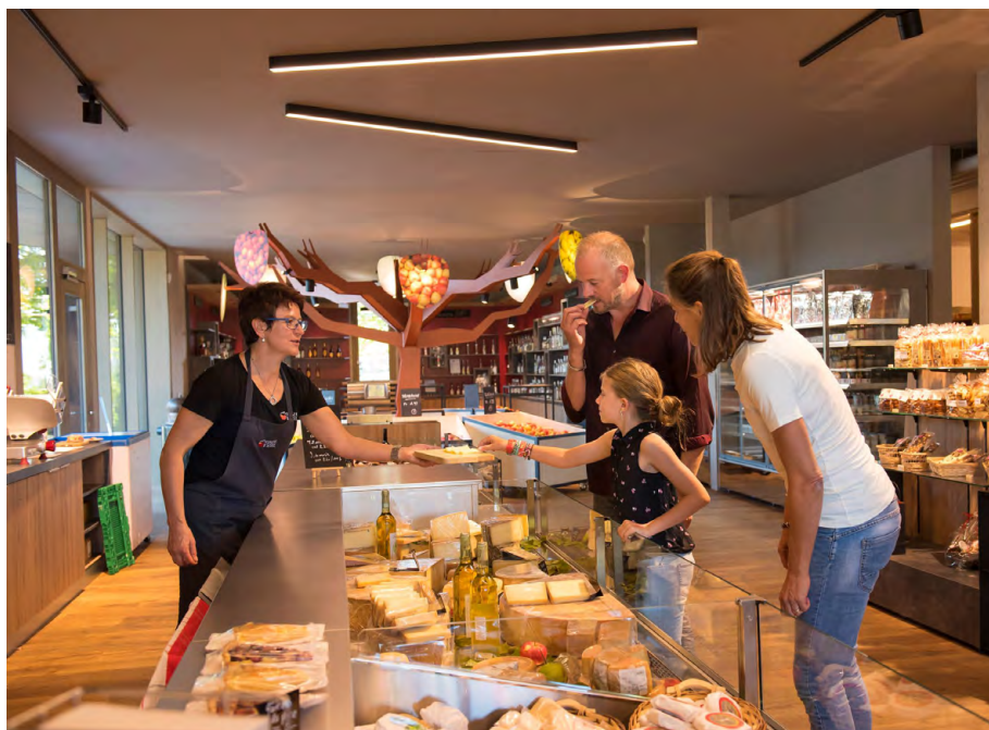
Fig. 2: PDR Marguerite.

De 2016 à 2022, le projet de développement régional «Marguerite» a pour vocation de favoriser la coopération entre les secteurs de l'agriculture, de l'artisanat et du tourisme dans le canton du Jura ainsi que dans le Jura bernois. Ce PDR vise à donner un nouvel essor à l'agritourisme et à dynamiser la production et la vente de produits régionaux. Il est prévu, en particulier, de tirer parti du symbole cultu-