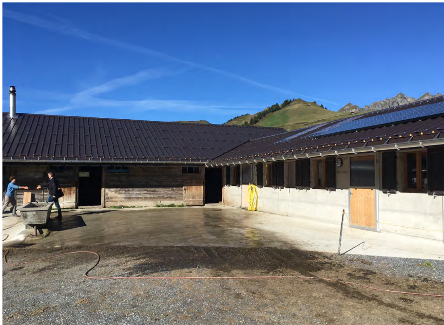
Fig. 3: PDR Val d'Illiez.

extensions du point de vente collectif de produits du terroir «La Cavagne» déjà existant et situé à Troistorrens. Ces deux mesures permettront de valoriser les