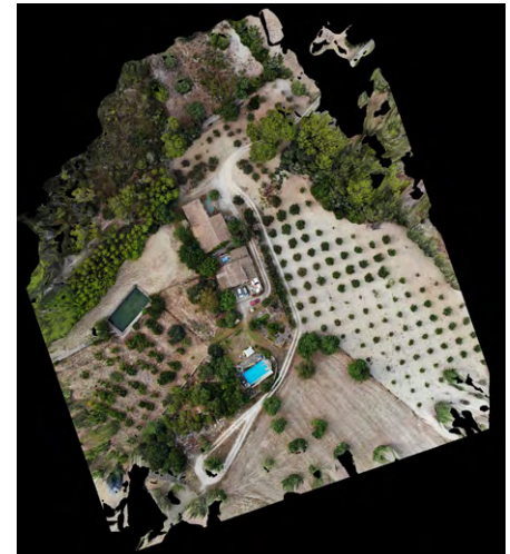
Abb. 1: Orthophoto Trescomte.

Luftbilder rund um die Ferienhäuser aufgefallen. Mithilfe einer sehr handlichen Multikopter-Drohne (DJI Mavic Pro), konnten wir das Projekt «Orthophoto Trescomte» in Angriff nehmen. Der Zeitaufwand für die Bilddatenbeschaffung inklusive Flugplanung war mit circa 15 Minuten sehr überschaubar. Für das Orthophoto mit einer Ausdehnung von ca. 150 m x 200 m und einer Bodenauflösung von 2 cm waren rund 140 Bildaufnahmen notwendig. Die vollautomatische Auswertung der Bilddaten zu einem Orthophoto und digitalem Oberflächenmodell beanspruchte rund zwei Stunden. Das Resultat wies, im Vergleich zu den verfügbaren Luftbildern, eine stark verbesserte Auflösung und Bildqualität auf. Wir werden das Endprodukt als Erinnerungstück in unser Fotoalbum aufnehmen.