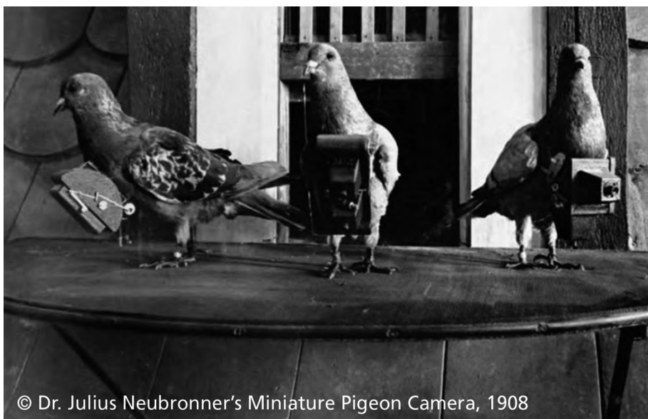
© Dr. Julius Neubronner's Miniature Pigeon Camera, 1908

Aufgrund seiner gegenüber dem vorherigen Sensor ADS80 deutlich verbesserten technischen Eigenschaften kann der neue Sensor ADS100 Luftbilder mit einer doppelt so hohen Bodenauflösung erfassen, ohne dass dadurch die Produktionskosten steigen. Die ADS100 besitzt einen breiteren CCD-Zeilensensor (20 000 Pixel statt 12 000 Pixel), eine geringere physische Grösse der Pixel (5 \mu\text{m} statt 6,5 \mu\text{m} ) und eine grössere Brennweite (120 mm statt 65 mm). Die beiden letztgenannten Parameter ermöglichen eine Verdopplung der Bodenauflösung bei ähnlicher Flughöhe. Sie führen jedoch zu einer Verringerung der vom Sensor am Boden abgedeckten Fläche (Abb. 2). Mit den 8000 zusätzlichen Pixeln wird diese an den Seiten verlorene Fläche jedoch grösstenteils wettgemacht, ohne dabei – dank der grösseren Brennweite – die Verkippung der Objekte zu verschlimmern. Die Qualität der Georeferenzierung wird durch die Verarbeitung der Bild-, Inertial- und GNSS-Daten gewährleistet. Auf diese Weise wird die Konsistenz zwischen den Luftbildprodukten und anderen Geodaten, z. B. in einem Geoportale, garantiert. Die Neuordnung der Auflösung der Gebiete in 10 cm und 25 cm (Abb. 3) sowie die Berücksichtigung der neuen Gebiets-einteilung (Abb. 4) erforderten eine detaillierte Überarbeitung der Flugplanung. Die neuen Fluglinien liegen geringfügig