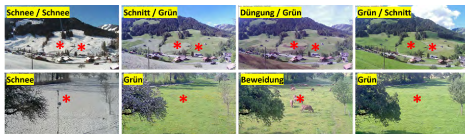
Abb. 1: Pro Webcam wurden ein bis drei Referenzpunkte (roter Stern) definiert und die täglichen Webcam-Aufnahmen visuell interpretiert. Hier dargestellt sind die Interpretationen von vier Aufnahmen für zwei Webcam-Standorte.

Fall also räumlich wie auch zeitlich hochaufgelöst sein. Dies würde bedeuten,